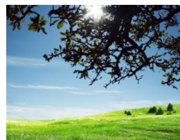
Summer is bright.