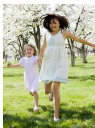
Spring is green.