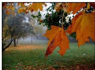
Autumn is yellow.