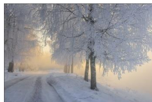
Winter is white.